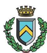
Comune di Mirandola